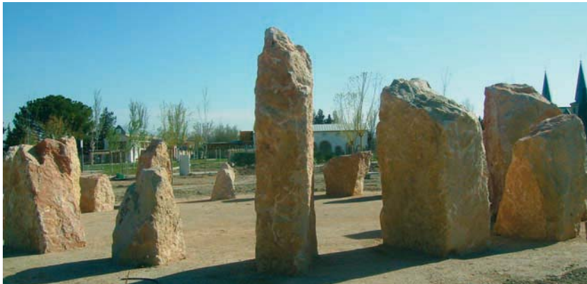
Jardín de Rocas La Alfranca.