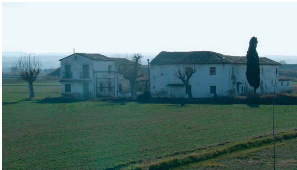
Torre del Pilar.