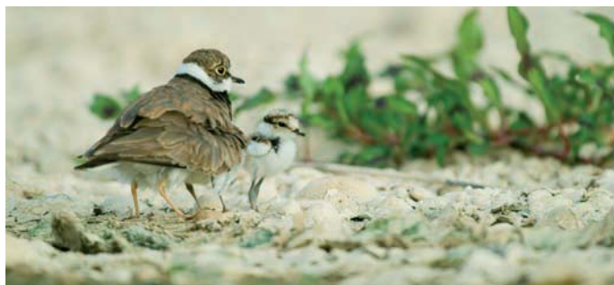
Charlitejo con pollos en una playa de gravas del río.

>> Las playas de gravas y las mejanas o islas. Estos espacios también son resultado de la dinámica fluvial del Ebro. El río arrastra gran cantidad de materiales que deposita en las orillas más convexas cuando pierde velocidad la corriente, formando los importantes acúmulos de gravas. Cuando estos materiales sólidos encuentran algún obstáculo en el cauce tiende a depositarse hasta formar una isla o mejana, que posteriormente es colonizada por la vegetación.